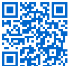
Start Steffisburg Damen und Herren